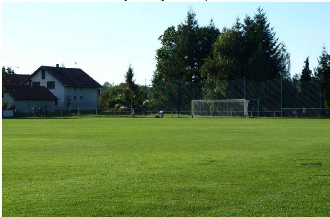
Slika 1. Nogometno igralište Donja Motičina